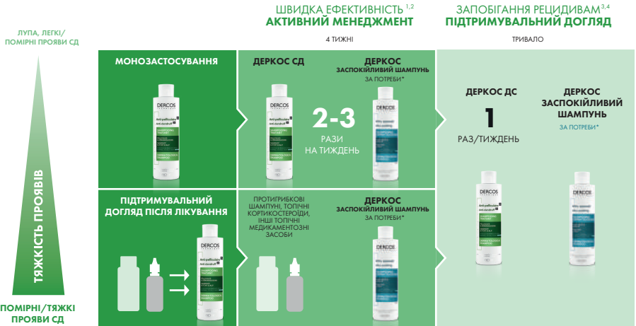
СХЕМА ЗАСТОСУВАННЯ ЗАСОБІВ ДЕРКОС ЗА БУДЬ-ЯКИХ ФОРМ СЕБОРЕЙНОГО ДЕРМАТИТУ